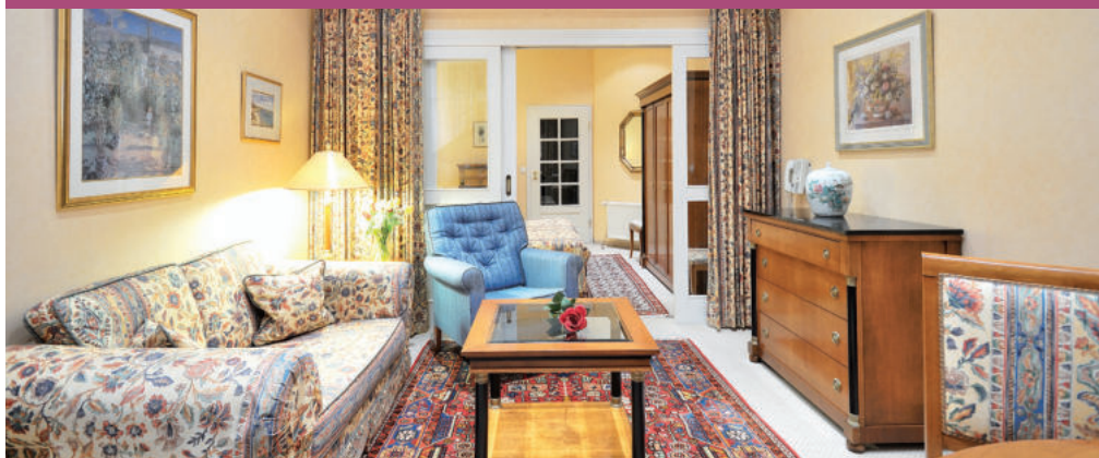
Zimmerkategorie B / 42 m 2