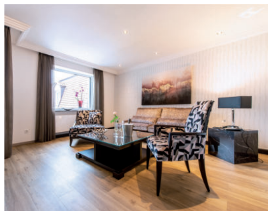
KATEGORIE 3 / 56 m 2