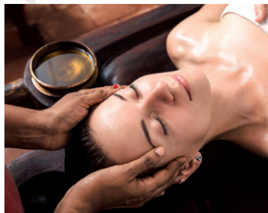
WELLNESSMASSAGE MIT AROMAÖLEN

Genießen Sie das wunderbare Gefühl, durch wärmende Öle vollkommen zu entspannen und gleichzeitig alles für die Schönheit Ihrer Haut zu tun. Das Öl wird durch die sanfte Massage von der Haut aufgenommen und stimuliert so Nervensystem, Blutgefäße und das Lymphsystem.