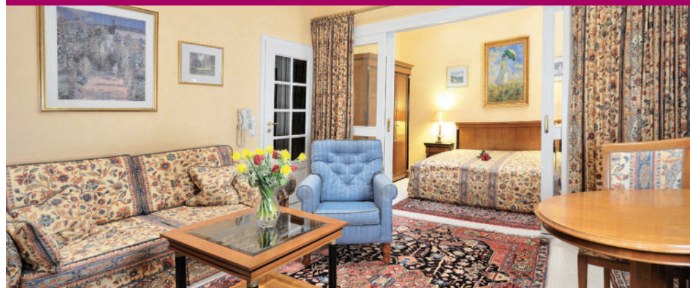
Zimmerkategorie D / 50 m 2