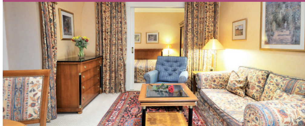
Zimmerkategorie C / 42 - 50 m 2