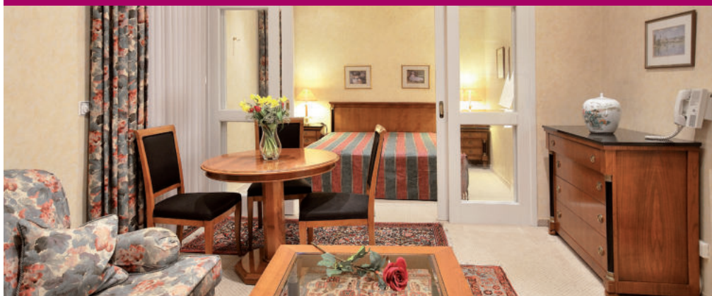
Zimmerkategorie A / 40 m 2