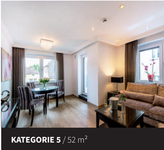
KATEGORIE 5 / 52 m 2

Für lärmempfindliche Gäste empfehlen wir eine Kategorie zum Rosengarten.