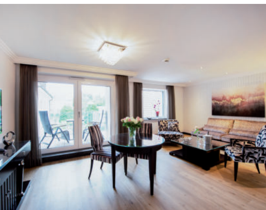
KATEGORIE 1 / 78 m 2