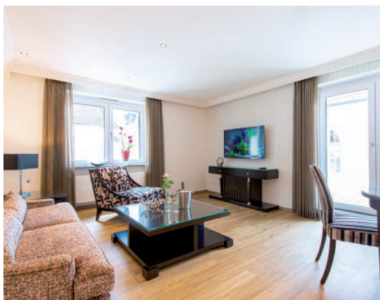
KATEGORIE 2 / 67 m 2