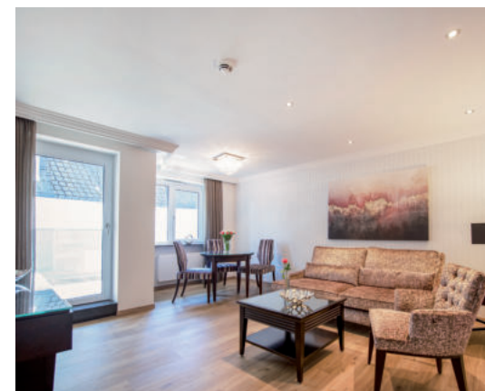
KATEGORIE 4 / 64 m 2