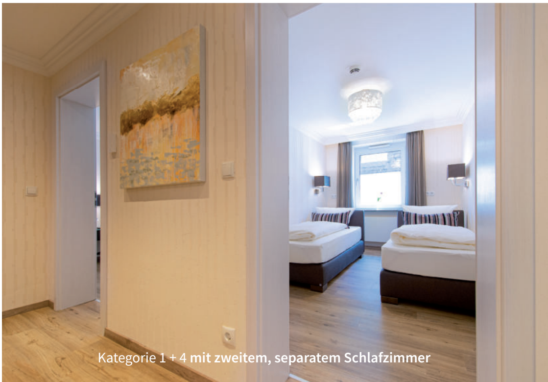
Kategorie 1 + 4 mit zweitem, separatem Schlafzimmer

Bester Schlafkomfort in unseren bequemen Boxspringbetten